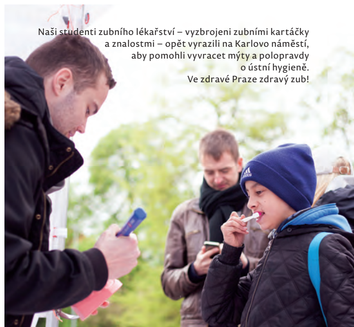
Naši studenti zubního lékařství – vyzbrojeni zubními kartáčky a znalostmi – opět vyrazili na Karlovo náměstí, aby pomohli vyvracet mýty a polopravdy o ústní hygieně. Ve zdravé Praze zdravý zub!