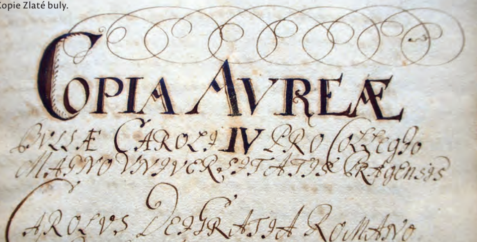
Kopie Zlaté buly.