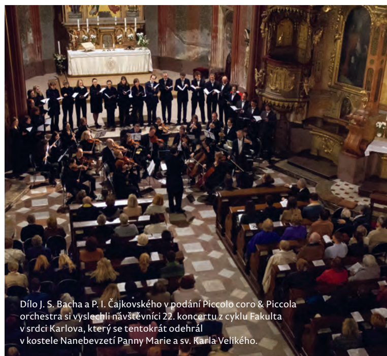
Dílo J. S. Bacha a P. I. Čajkovského v podání Piccolo coro & Piccola orchestra si vyslechli návštěvníci 22. koncertu z cyklu Fakulta v srdci Karlova, který se tentokrát odehrál v kostele Nanebevzetí Panny Marie a sv. Karla Velikého.