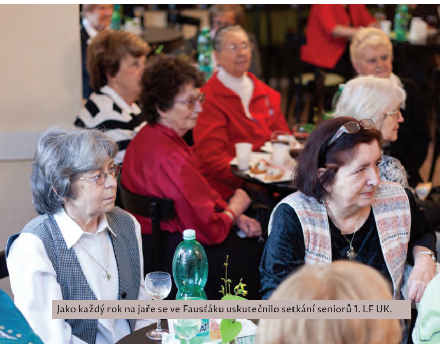
Jako každý rok na jaře se ve Faustáku uskutečnilo setkání seniorů 1. LF UK.