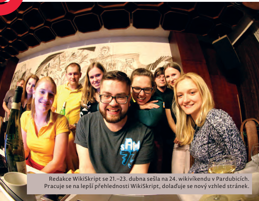
Redakce WikiSkript se 21.–23. dubna sešla na 24. wikivíkendu v Pardubicích. Pracuje se na lepší přehlednosti WikiSkript, dolaďuje se nový vzhled stránek.