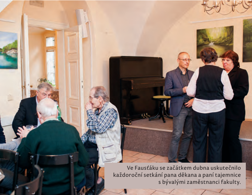
Ve Faustáku se začátkem dubna uskutečnilo každoroční setkání pana děkana a paní tajemnice s bývalými zaměstnanci fakulty.