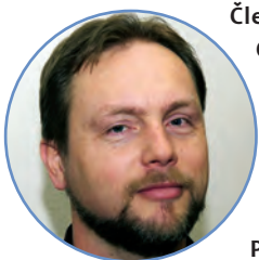
Členy týmu prof.