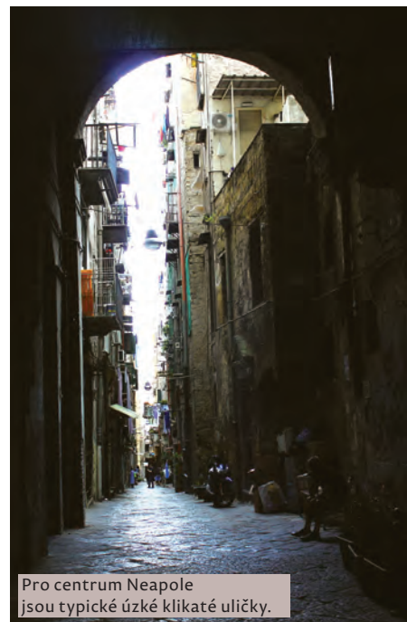
Pro centrum Neapole jsou typické úzké klikaté uličky.

Zuzana Mařová, studentka 6. ročníku všeobecného lékařství